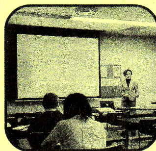
くらしとお金 安心のためのマネー入門