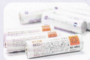
ニッケル水素電池