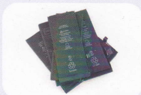
リチウムイオン電池