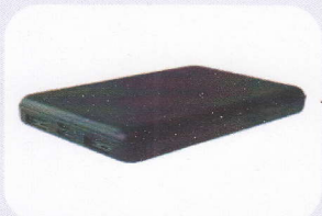
モバイルバッテリー