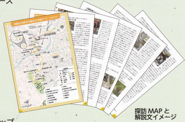
探訪MAPと 解説文イメージ

※販売場所によって、販売期間が異なる場合がございます。詳細は青葉区公式ホームページをご参照ください。 (横浜市歴史博物館での販売は、休館日の都合上、6月4日(火)からとなります。) ※「現金のみ」でご購入いただけます。あらかじめご了承ください。