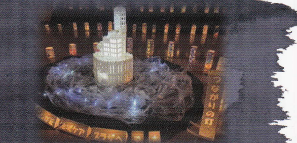
(令和4年9月25日 当ケアプラザイベント風景)

認知症になっても暮らしやすいまちは、誰にとっても 暮らしやすい居場所です。 そんな素敵な場所になれるようにと願いを 込めてつくられたキャンドル。 このまちに暮らす人たちの「こころの灯」が光の数珠玉のように つながっていきますように。