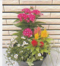
写真はイメージとなります