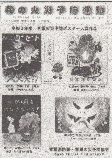
青葉消防署火災予防啓発ポスター

春の火災予防運動の広報として、「青葉消防署火災予防啓発ポスター」を作製しました。