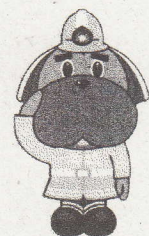
横浜市消防局 マスコットキャラクター ハマくん

ポスターは春の火災予防運動期間に青葉区内の自治会掲示板、小学校、駅、青葉消防署ホームページに掲示しますので、ぜひご覧ください。