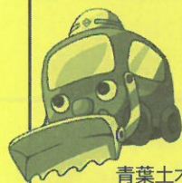
青葉土木のマスコットキャラクター ドボムくん

青葉区はまちがきれいです。住民のまちへの関心度が高く、そのことは未然の事故を防ぐことにつながり、結果、安全なまちが形成されます。40年前に一斉に開発が行われ、整備された道路や街路樹、公園など数の上では他区を寄せ付けません。(なるほどあおば参照) その結果、街路樹は生き茂り、あるいは樹齢が高くなり多くの手入れが今一挙に必要となってきました。公園の樹木も同じです。整備は、地区に分けて数年かけて行います。中には強剪定ではないかと思われる街路樹もありますが、数年先を考えて「仕立て直し剪定」を行っています。まちの「みどり」を「量から質へ」バランスのとれた街の景観へ整備を進めています。植え替え時期での樹種選定は専門家や地元との話し合いも含め慎重に進めています。青葉区には200を超える公園があり、多くの公園愛護会がボランティア活動をされています。また道路沿いの美化活動をするボランティアを支援するハマロード・サポーター(道の里親制度)というものもあります。奈良町に今度新しい公園ができます。地域の方たちが楽しく安全に利用できるよう、今日も作業車を走らせています。ぜひ、声を掛けてください。