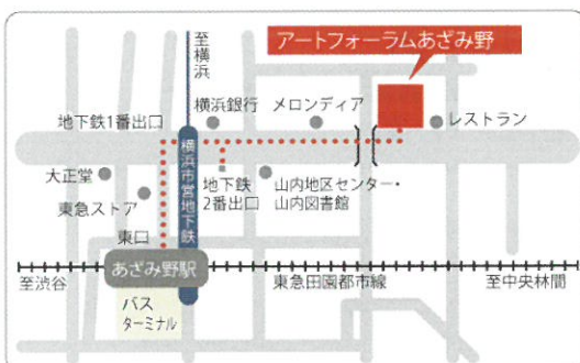
◀アートフォーラムあざみ野地図▶

※第1・2・6回の会場のアートフォーラムあざみ野では、一時保育があります。セミナー申込後、ご予約ください。（有料・先着順） 1歳6カ月～未就学児：各回4日前までに要予約 【問合せ】子どもの部屋（直通） 電話 045-910-5724 受付時間 9：00～17：00（第4月曜・年末年始除く）