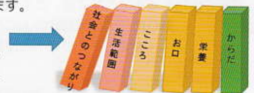
図2 フレイルドミノ