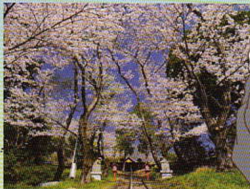
H 29 横浜美術大学賞