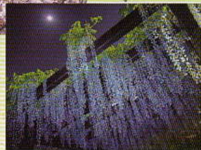
H 29 最優秀賞