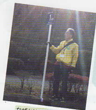
なぜか神々しさすら...