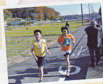
追い付け追い越せ! まけないぞ