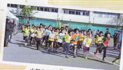
小学生の部2kmスタート