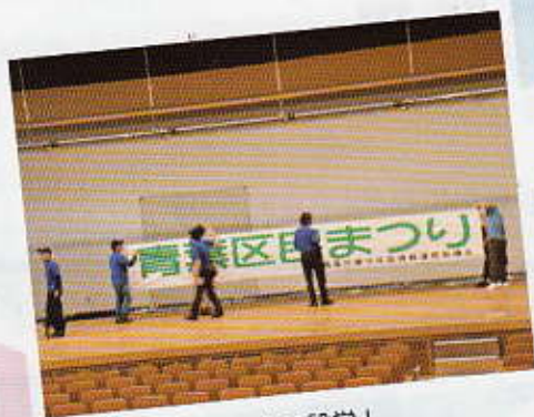
前日から設営！ ステージ看板もみんなで取り付け

小学生から高校生の皆さんのダンスや吹奏楽、一般公募による青少年団体のライブパフォーマンスなど合計300人以上の子どもたちが日ごろの練習の成果を青葉公会堂と野外特設ステージで発表しました。この企画・運営は毎年青少年指導員が担当しています。