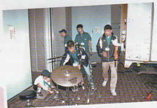
楽器の運搬もお手伝い！