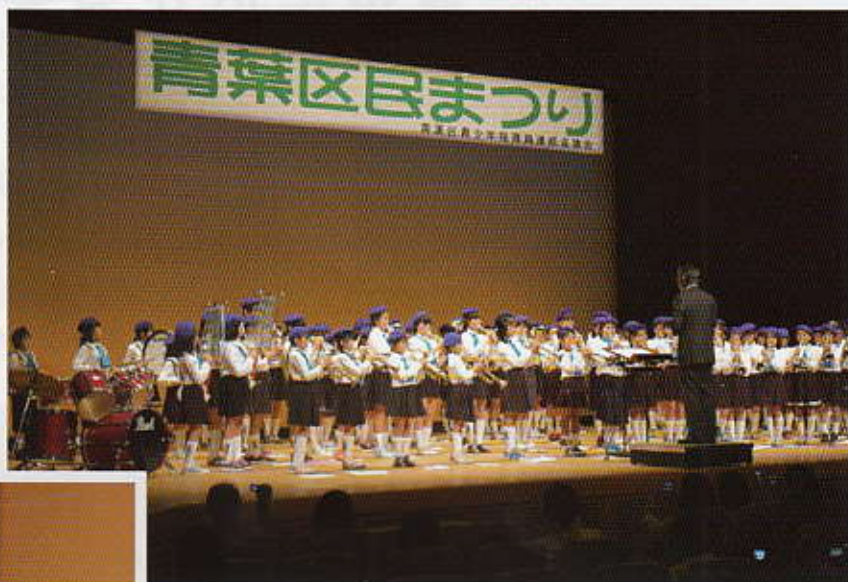
田奈小学校80人によるトランペット鼓笛演奏