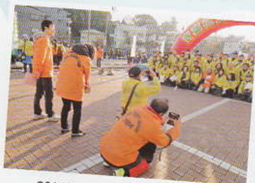
2014年からのスタッフジャンパー 毎年ずっと着ています

普段は走れない公道を約800人が駆け抜ける「青葉区民マラソン大会」では、沿道警備など70人が運営に参加し応援しました。