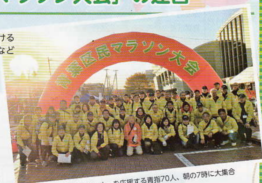
青葉マラソンランナーを応援する青指70人、朝の7時に大集合