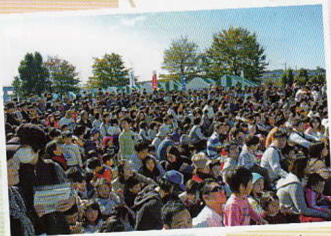
屋外ステージも大盛況！会場整理も青指がしています。 できるだけたくさんの皆さんに、安全に楽しんでほしいから！