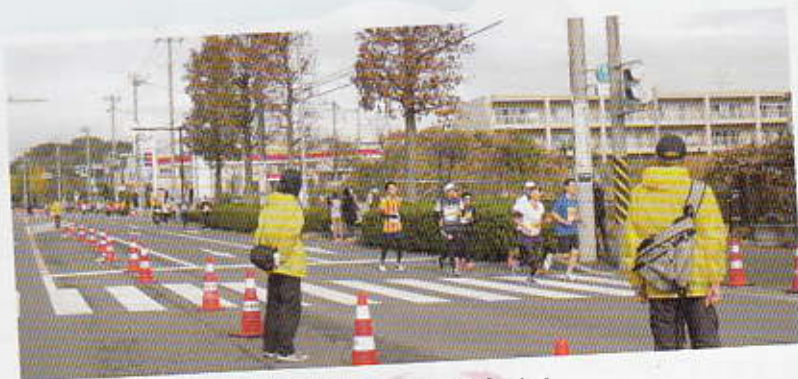
ゴールまでラストスパート!