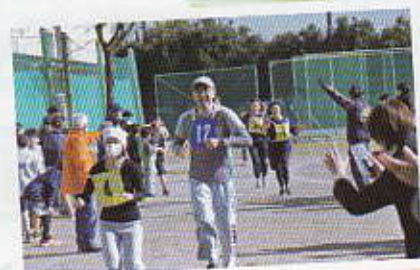
苦しいけれど、笑っちゃう! 応援ありがとう!

小学生から大人まで老若男女270人のランナーが、田園風景豊かなふるさとの街を走りました。中里北部の青少年指導員は、連合町内会やスポーツ推進委員など100人を超える地域の方々と連携してランナーが安全に楽しく走れるようにサポートしました。