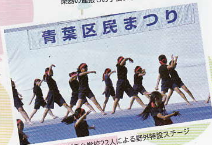
つつじが丘小学校22人による野外特設ステージ