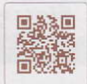
ラウンジ QR コード