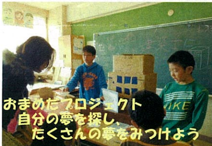
おめでとうプロジェクト 自分の夢を探し、 たくさんの夢を見つけよう

↑5年生 「あまり人が来てくれないかと思っていただけ、たくさんの方が楽しんで聞いてくれてうれしかったです。相手に一番伝えたいことをはっきりとわかりやすく発表する力が付きました。」