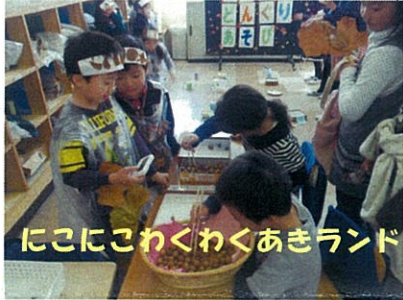
ここにこわくわくあきランド

11/16 (土) に開催した美小フェスタでは、子どもたちがいきいきと発表する姿が見られました。たくさんの保護者の方、地域の方々の温かい見守り、ありがとうございました。