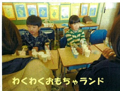
わくわくおもちゃランド

「110番、119番へのかけ方や、どこにつながるかなどの通報の仕組みを知ってもらうコーナーを担当して、とても楽しかったけれど、いそがしかったです。」 ↓4年生