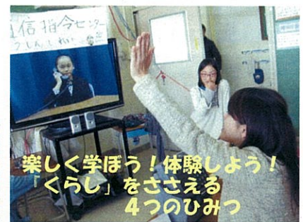
楽しく学ぼう！体験しよう！ 「くらし」をささえる 4つのひみつ

「110番、119番へのかけ方や、どこにつながるかなどの通報の仕組みを知ってもらうコーナーを担当して、とても楽しかったけれど、いそがしかったです。」 ↓4年生