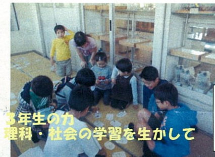
3年生の力 理科・社会の学習を生かして

←3年生 「地図記号カルタのじゅんぴはすごくいっぱいやってもらってたいへんでした。本番でうまくできてよかったです。」