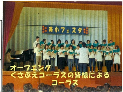
オープニング くさぶえコーラスの皆様による コーラス

「ビー玉ころがしにいっぱいおきゃくさんがきてくれてよかった。やさしくやりかたをおしえてあげられました。」 ↓2年生