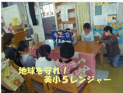
地球を守れ！ 美小5レンジャー