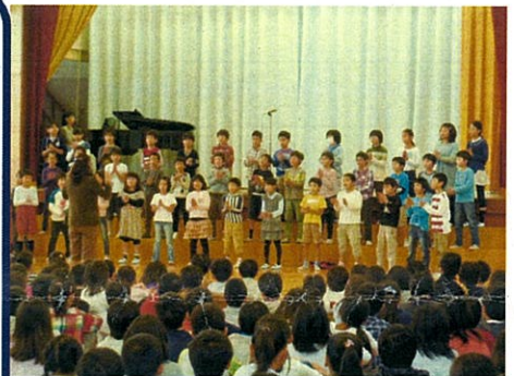
11/11(月) 体育館で全校の前で発表

1番目から4番目までの学校は、とても声がきれいで、心がひとつになっていくようでした。リコーダー演奏も、タンギングがとてもきれいでした。私たちの出番がきたときに、歩くときも笑顔で、ステージに上がりました。1曲目の前奏が始まったとたんに、ドキドキしました。歌い始めたらだんだんドキドキするのもおさまって、もっときれいな声で歌いました。わたしは、あこがれの音楽会に出られたので、とても思い出に残りました。