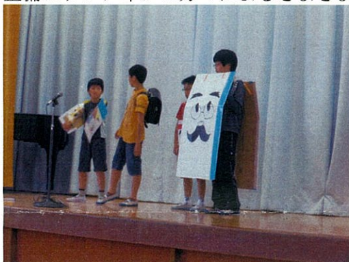
↑ 図書委員会による集会発表（10/25）

10/28から11/8まで読書週間として、本に親しんでほしいと図書委員会や読み聞かせ・図書室整備ボランティアの方々によるさまざまな取り組みが行われました。