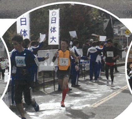
給水地点(青葉自動車学校前)