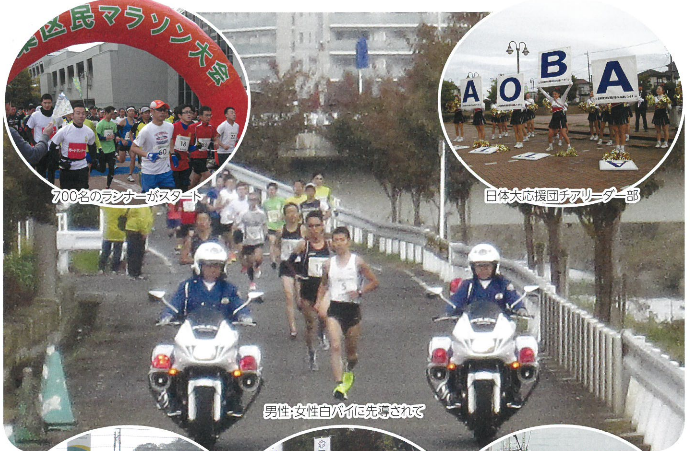
男性・女性白バイで先導されて