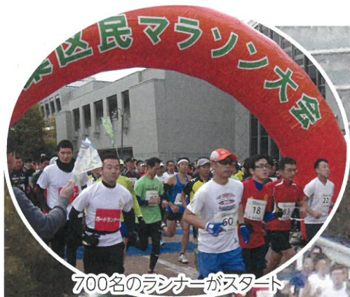
700名のランナーがスタート

平成28年11月27日（日）第3回青葉区民マラソン大会が晩秋の快晴のもと開催され、700名のランナーが力走しました。体育協会（75名）は沿道警備等に参加して大会をサポートしました。