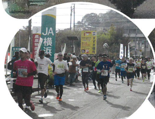
食料補給地点(JA横浜中里前)