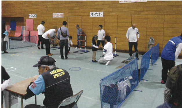
ラダーゲッターに挑戦