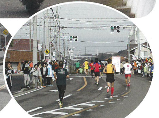
中間地点(住谷本地区)