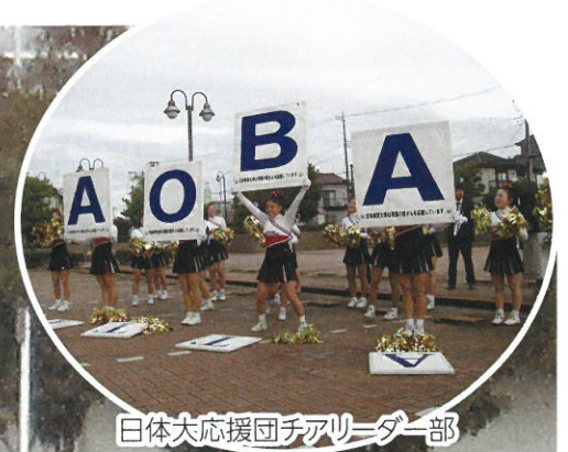
日体大応援団チアリーダー部