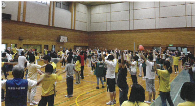
音楽に合わせて、みんなで踊りました。

6 月 18 日 (土) 「スポーツでつなぐ ふれあいのバトン」をテーマに青葉区の障がいのある方々の「2016 青葉ふれあいまつり」が青葉スポーツセンターで開催されました。体育協会ではこのまつりに賛同し会場準備、競技進行、用具の準備等に協力いたしました。270 名余の参加者が玉入れ、パン食い競走、さわやかスポーツ体験等に挑戦しました。