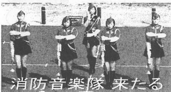
消防音楽隊 来たる