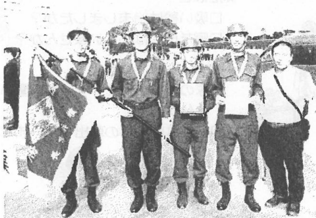
屋内消火栓操法(男性・混成)の部 優勝 日本体育大学 横浜・健志台キャンパス

青葉区からは『たまプラーザテラス』『日本体育大学横浜・健志台キャンパス』『三菱化学(株)横浜センター』が青葉区大会を勝ち上がって出場し、屋内消火栓操法(男性・混成)の部で日本体育大学横浜・健志台キャンパスが優勝、小型ポンプ操法の部で三菱化学(株)横浜センターが3位に輝きました。