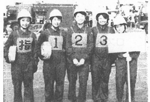
屋内消火栓操法(女性)の部 出場 たまプラーザテラス