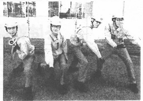
小型ポンプ操法の部 3位入賞 三菱化学(株)横浜センター