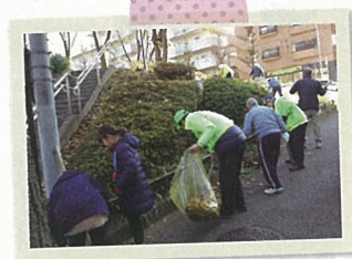
つつじ坂通り清掃活動

この活動を通じて、住民同士の親睦が深まり、連携、互助の機運が高まり、“いつまでも住み続けたい街”と住民の皆さんに感じてもらうことを願っています。