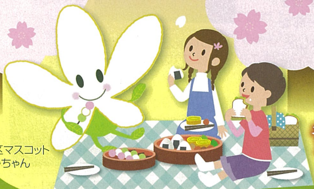
青葉区マスコット なしかちゃん