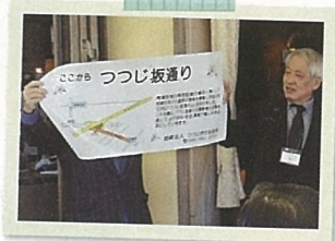
愛称が決まりました