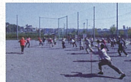
平成27年度の講座の様子

生涯元気!の「元気で長寿促進運営委員会」です。講座修了生の40代~70代女性6名、男性6名の世代を越えた明るい12名で「介護予防」啓発の活動をしています。超高齢社会の日本、避けて通れない体力の衰えや認知機能の低下など、マイナス面だけに目を向けたり嘆いたりするのではなく、工夫する事で向上する機能を増やし、歳を重ねる事でしか得られない人生の経験や楽しみ方に目を向け、健康寿命を伸ばす事を目的として講座を企画運営してきました。今後は、講座の1つとして実施した「ポールウォーキング」を定期的に青葉区内で実施していく予定です。多くの方に体験して頂きながら、介護予防と元気な仲間作りに貢献できればと思っています。どうぞお楽しみに!