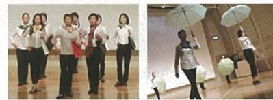
平成27年度発表会(「アートフォーラムあざみ野」にて)