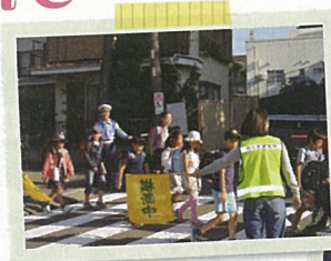
児童・生徒の見守り

定期的な交通安全研修の実施、交通安全を啓発する標識の設置なども行いながら、“事故のない安全・安心な街”、“この街に住んで良かったと誰もが感じる街”となるよう、地域一丸となって活動しています。