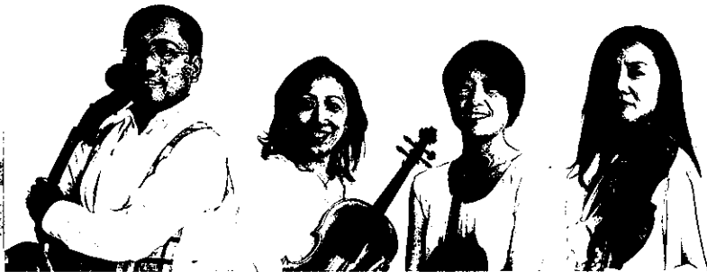
カルテット・エクセルシオ

年間70公演以上を行う、日本では数少ない常設の弦楽四重奏団。ベートーヴェンを軸とした『定期公演』、20世紀以降の現代作品に光をあてる『ラボ・エクセルシオ』、人気傑作選『弦楽四重奏の旅』、第一生命ホール「ストリング カルテット・ウィークエンド」の4シリーズを展開しつつ国内外で活動。加えて、幼児から学生、地域コミュニティを対象に、室内楽の普及にも力を注ぐ。'94年結成。第5回パオロ・ボルチアーニ国際弦楽四重奏コンクール最高位、'08年第19回新日鐵音楽賞「フレッシュアーティスト賞」、'14年第16回ホテルオークラ音楽賞など受賞歴多数。現在、「サントリーホール室内楽アカデミー」コーチング・ファカルティとして後進の指導にもあたっている。昨年結成20年を迎え、さらに活躍が期待されている。