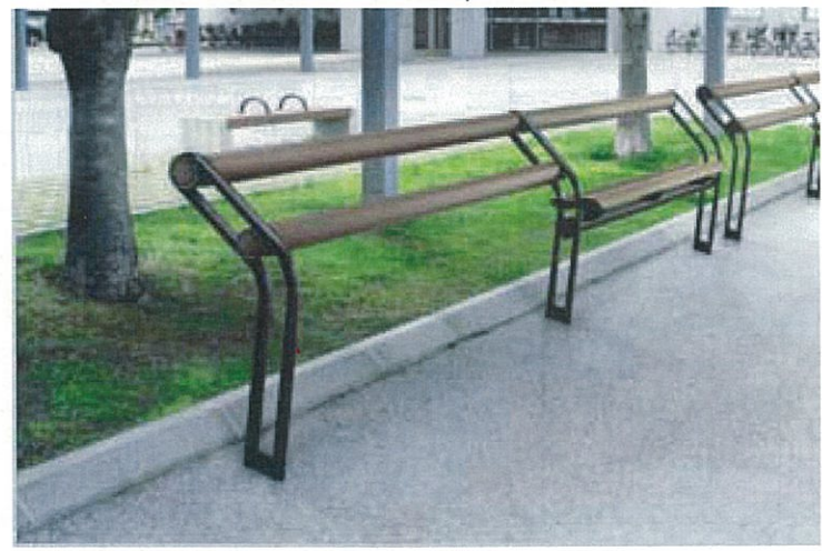
ベンチ (公園入口付近に設置)