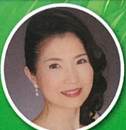
魚本ゆかり(ソプラノ)