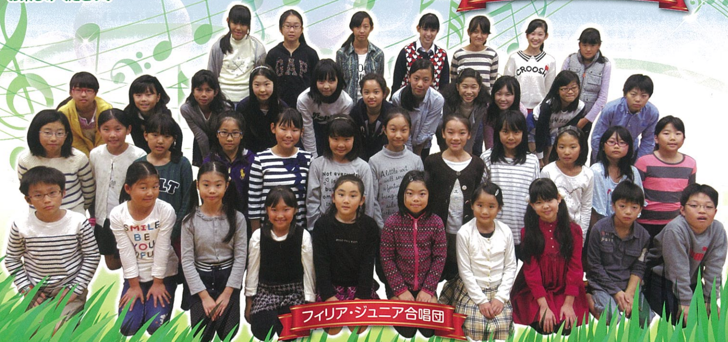
ファイリア・ジュニア合唱団