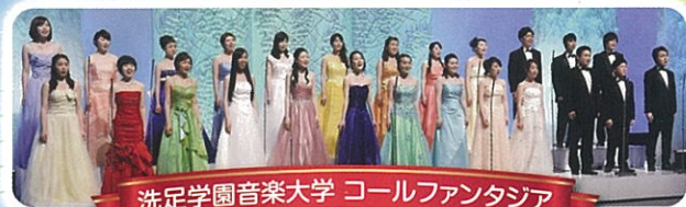
洗足学園音楽大学 コールファンタジア

青葉区の小中学生で結成されたファイリア・ジュニア合唱団。 今年は新たなメンバーで、洗足学園音楽大学「コールファンタジア」の メンバーとプロのゲストの支援にて、充実したコンサートを開催します。 子どもたちが伸びやかに歌う姿、ゲストの心に響く歌声を お楽しみください。