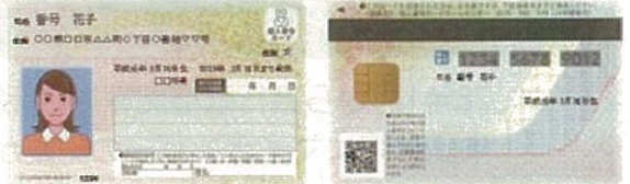
個人番号カードイメージ

個人番号カードにはマイナンバーも記載されて います。顔写真付きなので本人確認資料として も使用できます(初回交付は無料)