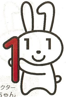
マイナンバーキャラクター マイナちゃん