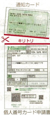
個人番号カード申請書