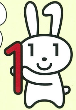
マイナンバーキャラクター 「マイナちゃん」