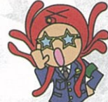
こわくなったら おおごえて