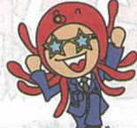
おともだちと あそぼうね