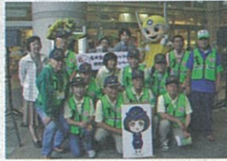
横須賀防犯協会 防犯啓発キャンペーン

問合せ先 神奈川県自転車商協同組合 045-311-6168 http://www.kanasho.jp