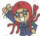
うちのひとにいきます