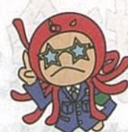
だまされて ついていかない