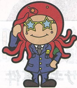
僕の名前は、おおだこポリス