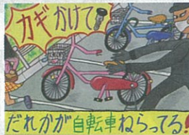
だれかが自転車ねらってる! 最優秀賞 横浜市立中田小 5年 崎本 彩夢