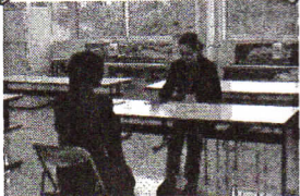
学校運営協議会委員による、3年生面接練習 (1/14~1/30)