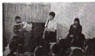
生徒会役員が美中の学校生活を 新入生保護者に説明 【新入生保護者説明会 (2/19)】