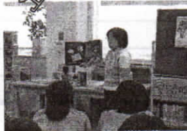
山内図書館司書による1年生対象ブックトーク (11/11)