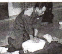
青葉消防署 元石川出張所の指導による教職員のAED研修 (11/18)