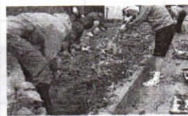
社協の指導による個別支援学級校内農園いも掘り (11/20)