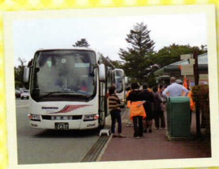
「バスハイク」 市ケ尾地区