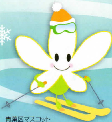
青葉区マスコット なしかちゃん

そんな大切な地域の活動を紹介する情報紙を発行しています。いろんな地域の宝物をなしかちゃんが探しにいきます。