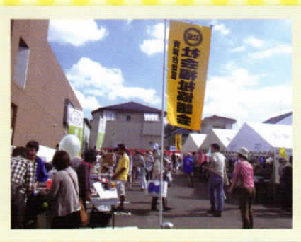
「福祉まつり」 青葉台地区

地区社会福祉協議会に関するお問い合わせ：青葉区社会福祉協議会 ☎045-972-8836