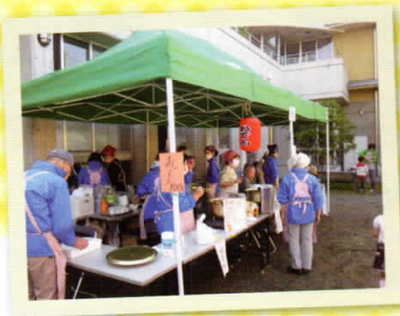
「ケアプラザまつり出店」 谷本地区