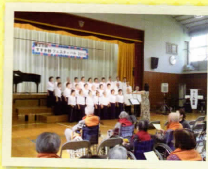
「ふれあいフェスティバル」 すすき野地区