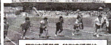
個別支援学級・特別支援学校 合同体育祭 (9/26)