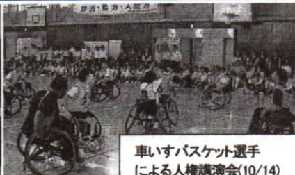
車いすバスケット選手 による人権講演会(10/14)