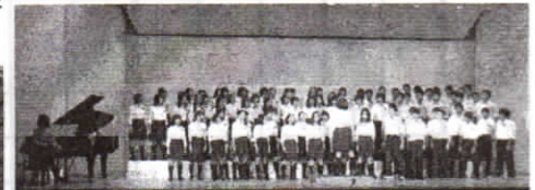
3年全体合唱 「大地讃頌」