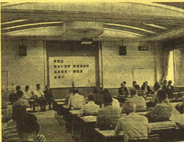
委嘱式は区役所 4 階会議室で開催されました

明推協推進委員・推進員の希望者で構成された企画運営チーム代表の藤本推進委員から、区民まつりへの出店やイコット通信発行などの活動内容をご紹介していただき、企画運営チームへの新たなメンバー参加を働きかけました。