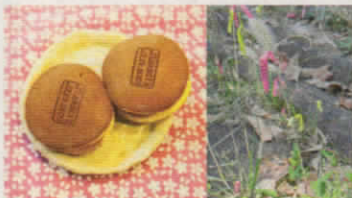
谷山恭子 <Lat/long project> 2012,2011

作家: 大津芳美 日程: 10/2(木)、3(金) 場所: 東洋英和女学院大学付属 かえで幼稚園 対象: かえで幼稚園生