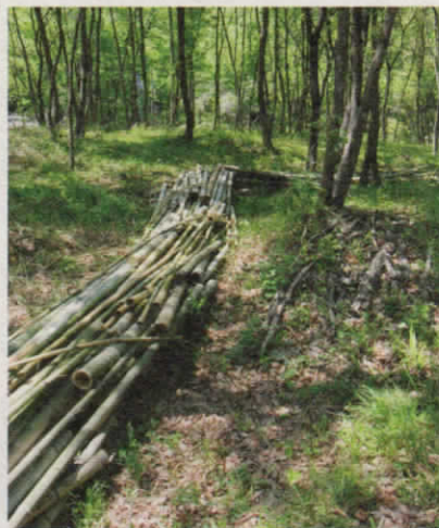
井口雄介 <OROCHI> 2014