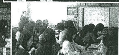
美しが丘中学校区 PTA 連絡協議会 ケータイ安全教室 【2/20】