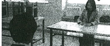
学校運営協議会委員による、 3年生面接練習