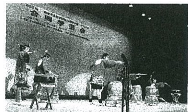
個別支援学級「合同学芸会」【1/31】