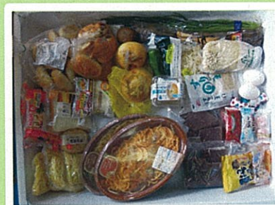
封を切らずにだされた野菜や弁当など