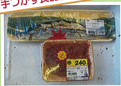
特売で買って使わなかった肉や魚