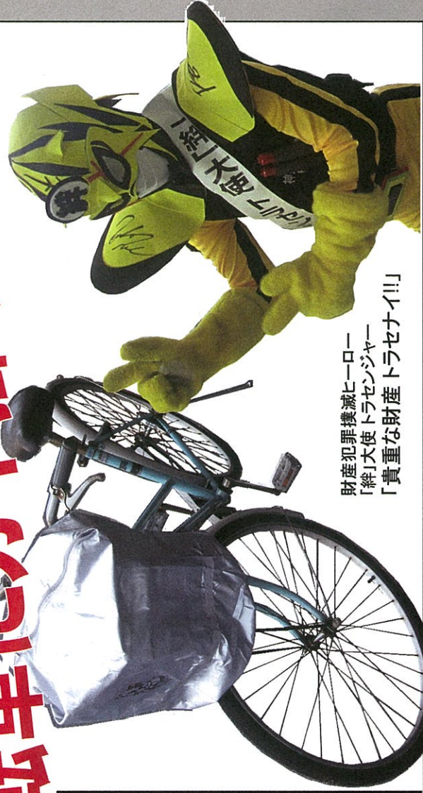
財産犯罪撲滅ヒーロー 「絆」大使トラセゼンジャー 「貴重な財産トラセナイ!!」