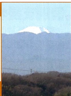
たまプラーザから望む富士山 (25年1月撮影)

美しが丘地区社会福祉協議会は、美しが丘1、2、3丁目の各団体の代表および個人が参加して組織構成され、社会福祉活動を進めていく任意団体です。地域の皆さんが安全に安心して暮らせる街づくりを、福祉の面で支えて行きたいと願っています。